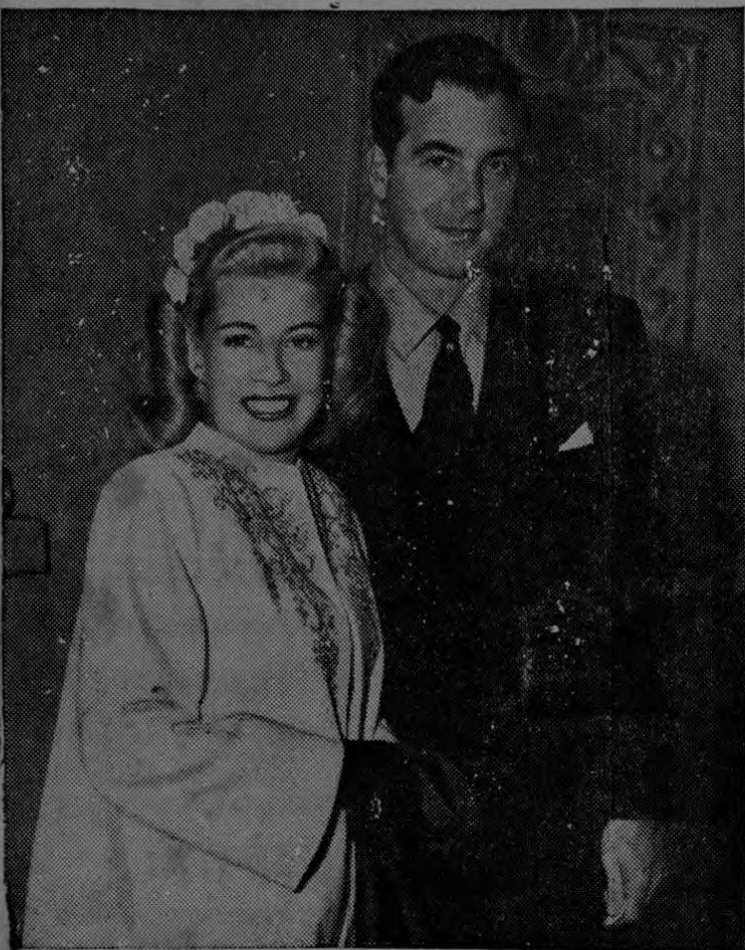
Gloria De Haven, joven actriz de la Metro-Goldwyn-Mayer, retratada en compañía de su esposo, John Payne, cuando ambos se dirigían al teatro.

LABORATORIOS BOTICA FRANCESA - fundada en 1868